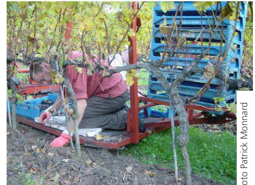
Plateforme de plantation des plants mottés (ici en vigne)