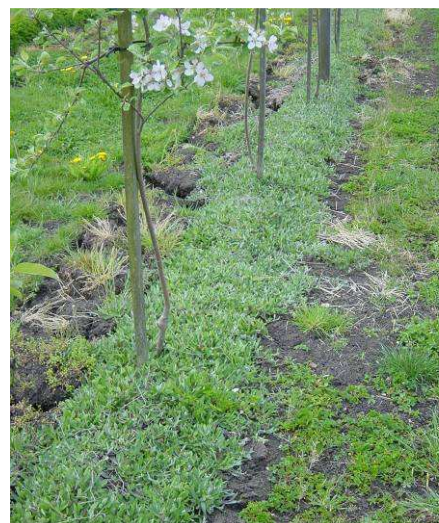
La piloselle couvre la ligne en 12 mois environ