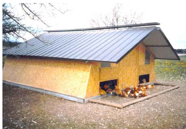
Des cabanes mobiles pour 300 poulets sont disponibles sur le marché